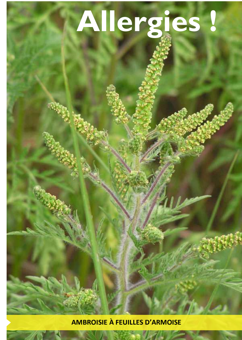
AMBROISIE À FEUILLES D'ARMOISE