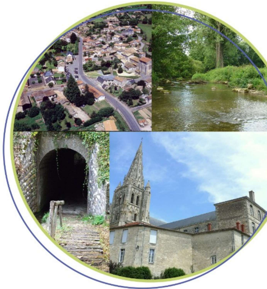
Schéma de Cohérence Territoriale du Haut Val de Sèvre