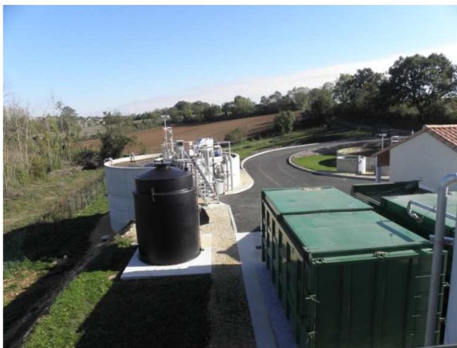
Illustration : Station de Pamproux