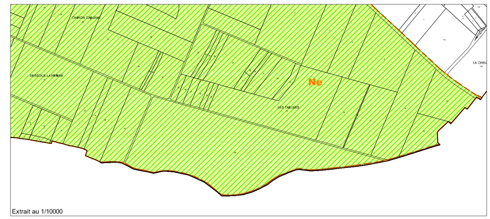
Extrait au 1/10000